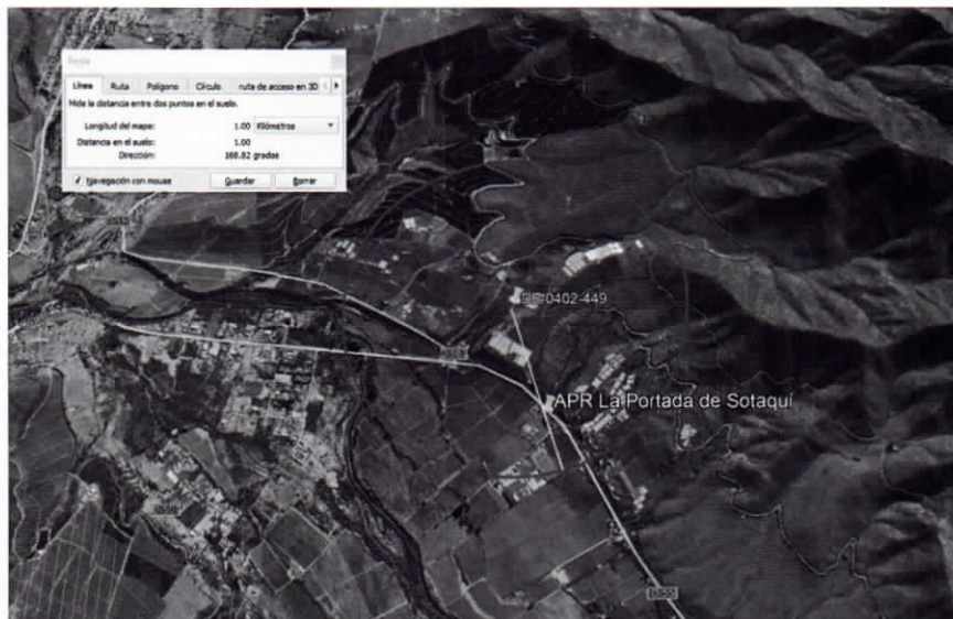
Imagen N° 3: Se registra un Sistemas de Agua Potable Rural ubicados en un radio menos o igual a 1 (uno) kilómetro, medidos desde la ubicación de la captación informada cuyas coordenadas son: Norte: 6.613.374 metros y Este: 294.956 metros, UTM WGS 84, HUSO 19.

Imagen N° 2: Se identifica el punto DE-0402-449 pozo sobre el cual se está solicitando autorización temporal. Además el pozo Ramos – Fredez, que se encuentra seco y sin uso.