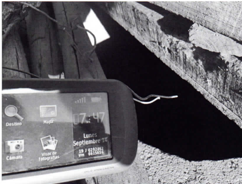
Foto 1: Ubicación referencial del pozo sobre el cual las solicitantes tienen un derecho de aprovechamiento que por razones de escasez no pueden usar. Ccoordenadas UTM, WGS 84, Norte: 6.615.656 metros y Este: 292.462 metros.