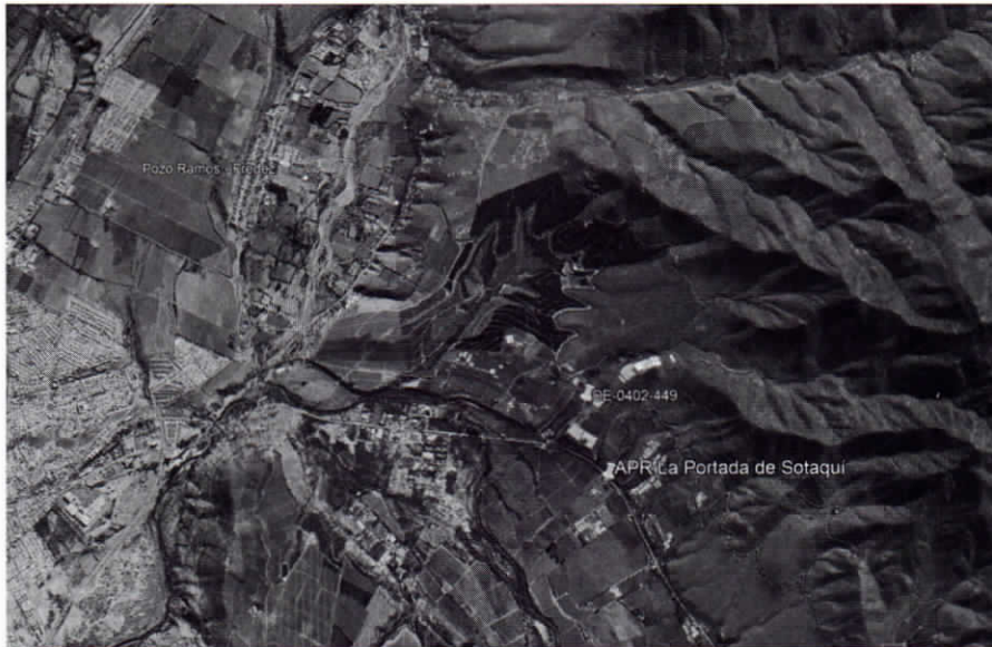
Imagen N° 2: Se identifica el punto DE-0402-449 pozo sobre el cual se está solicitando autorización temporal. Además el pozo Ramos – Fredez, que se encuentra seco y sin uso.

Imagen N° 1: Antecedentes del expediente DARH VPC-0402-184, a la fecha pendiente en el Servicio. El punto de captación origen y el punto de destino coinciden con los pozos sobre los cuales se ha generado el presente informe y expediente DE-0402-449.