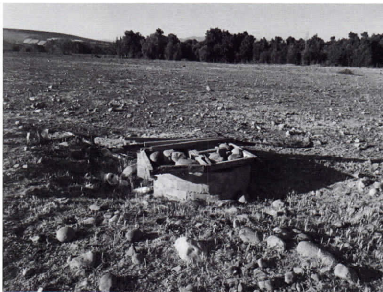
Foto 2: Se advierte durante la inspección en terreno que el pozo se encuentra sin uso y seco.